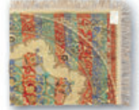
Decke mit orientalischen Motiven aus der Serie „Portugal“, produziert in der Weberei Paul Zierold