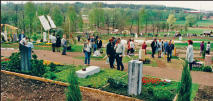
Besucher im Grünthal, im Vordergrund Präsentation von Grabpflanzungen

Die Ausstellungen auf der Unteren Käßplerwiese waren nur für den Zeitraum der Gartenschau angelegt worden: Alte Apfelsorten wurden vorgestellt sowie Sträucher, ein Kräutergarten, nachwachsende Rohstoffe, Trockenmauern, Mustergrabanlagen, Dalienzüchtungen und das Modell eines Solarbrunnens.