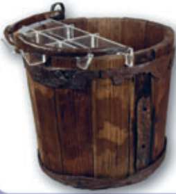
Schöpfeimer mit Eisenbeschlägen und Henkel