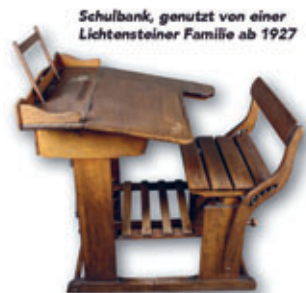
Schulbank, genutzt von einer Lichtensteiner Familie ab 1927