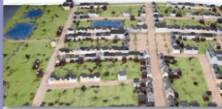
Ein Stadtmodell zeigt Callenberg in der Zeit um 1850