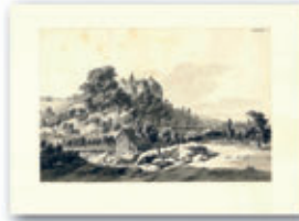
Federzeichnung von Adrian Zingg um 1775