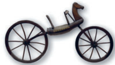
Laufrad eines Lichtensteiner Postboten, genutzt 2. Hälfte 19. Jh.