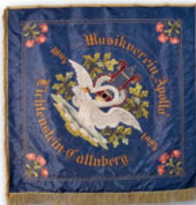
Fahne des Musikvereins „Apollo“, 1924