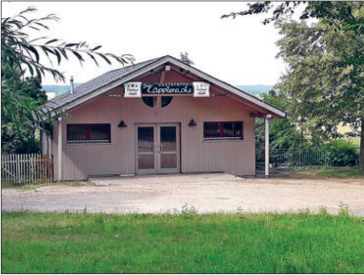
(damals war die Gaststätte nicht mehr bewirtschaftet)