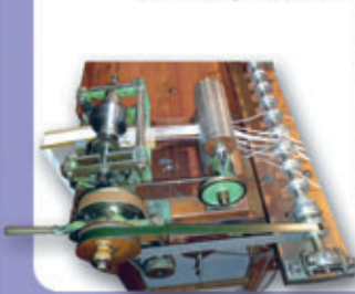
Lichtenstein/Sa. war ein Zentrum der Chenilleweberei im mitteleuropäischen Raum