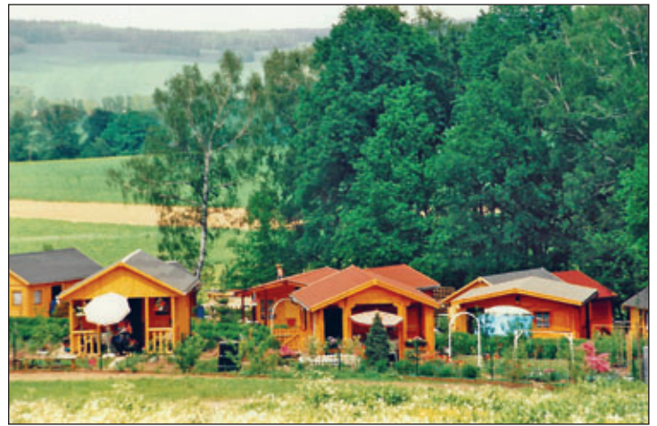
Neue Gartenlauben in der Anlage „Obere Käßplerschlucht“

Als die Pächter der Kleingartenanlage „Obere Käßplerschlucht“, die sich hinter dem Palais befand, von einer geplanten Umsiedlung erfuhren, wehrten sie sich. Diese Entscheidung war ohne sie getroffen worden. Es folgten harte Auseinandersetzungen, bis schließlich die Anlage etwa 800 Meter nach Norden verlagert werden konnte. Die neue Anlage trägt den alten Namen. Während der Gartenschau standen vier Mustergärten offen.