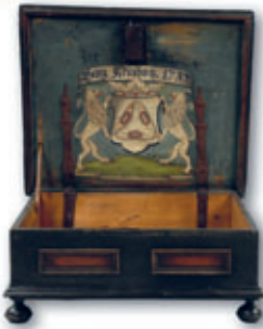
Innenslade der Lein- und Wollweber, 1737