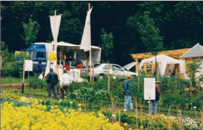
Nachwachsende Rohstoffe