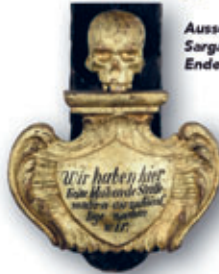
Ausschnitt, Sargauflegekruzifix, Ende 17. Jh.