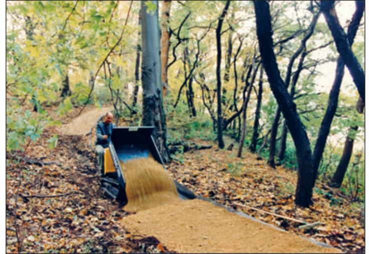
Schieferberg Wegebau 1994

In dem Wald zwischen dem Schloss und den Kleingärten wurden Wege erneuert. Der damals entstandene Waldspielplatz wurde 2002 abgebaut. Das Holz war verrottet.