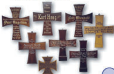
Gedenkkreuze Erster Weltkrieg