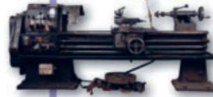
Die einzige Maschinenfabrik im Ort stellte Zug- und Leispindel-Drehmaschinen her, wie diese aus den 1920/30er Jahren.