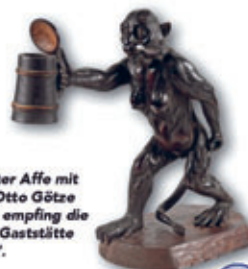
Ein geschnitzter Affe mit Bierglas von Otto Götze (1861 – 1937) empfing die Besucher der Gaststätte „Centralhalle“.