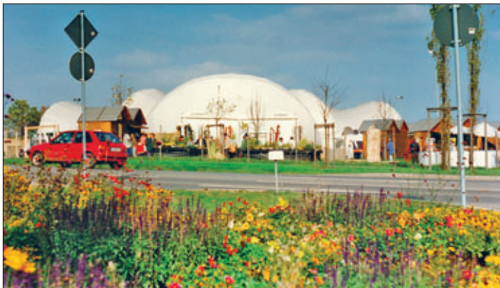
Blick über die Glauchauer Straße zur Festwiese mit dem Festzelt 1996.

Unmittelbar an das Gewerbegebiet schließt sich die neue Festwiese an. Sie sollte als Ersatz für die bisherige grüne Festfläche am Haus der Einheit dienen (heute Rewe-Markt). Die Fläche wurde von neu gepflanzten Kastanienbäumen umrahmt. Während der Landesgartenschau stand dort ein großes Festzelt.