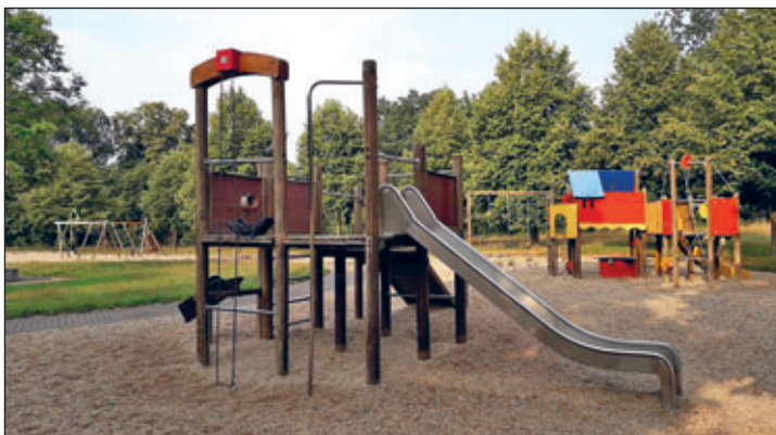
2019 standen noch mehrere Spielgeräte auf der Uhlig-Wiese.

Auf der gegenüberliegenden Seite der Festwiese befindet sich die Uhlig-Wiese mit einer Spiel Landschaft. Während der Gartenschau präsentierten sich dort Spielgerätehersteller. Die Anlagen wurden nach der Gartenschau von der Stadt erworben.