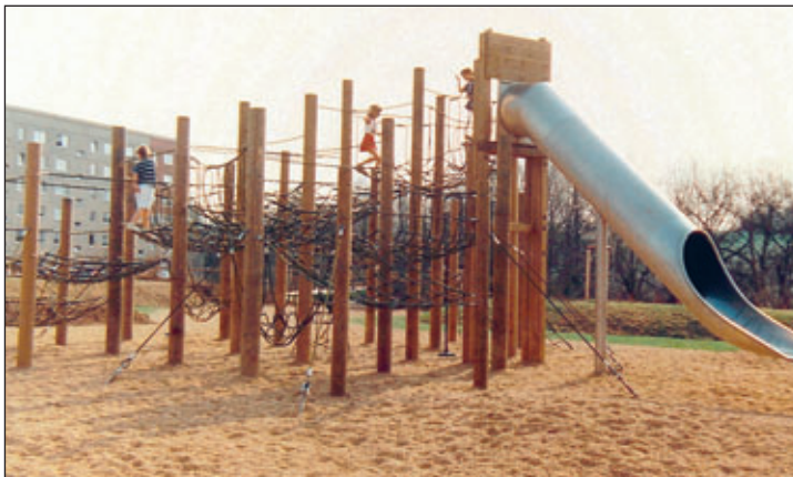
Der 1996 gebaute Spielplatz hatte nach über 20 Jahren ausgedient, 2019 wurden neue Spielgeräte eingeweiht.

Ein neu geschaffener Weg verbindet seit der Gartenschau das Gewerbegebiet mit der Ernst-Schneller-Siedlung. Mit viel Grün und Gestaltungselementen wurde das Wohnumfeld aufgewertet sowie ein Spielplatz und eine BMX-Strecke geschaffen.