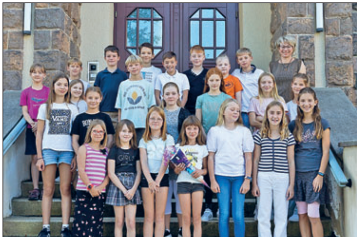
Klasse 5 d