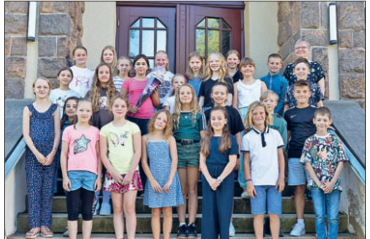
Klasse 5 c