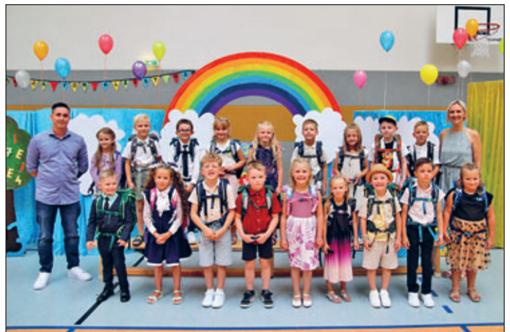
Klasse 1 b