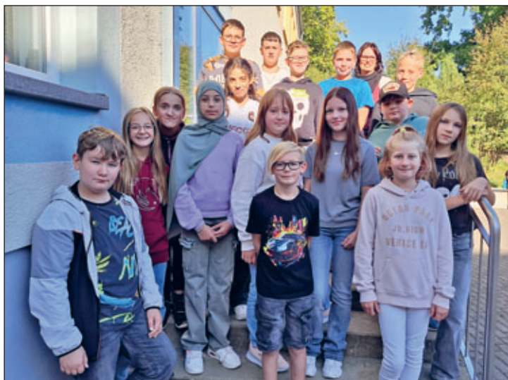
Klasse 5 a