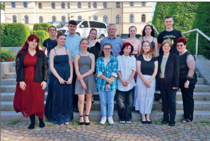
Abschlussklasse 10 a