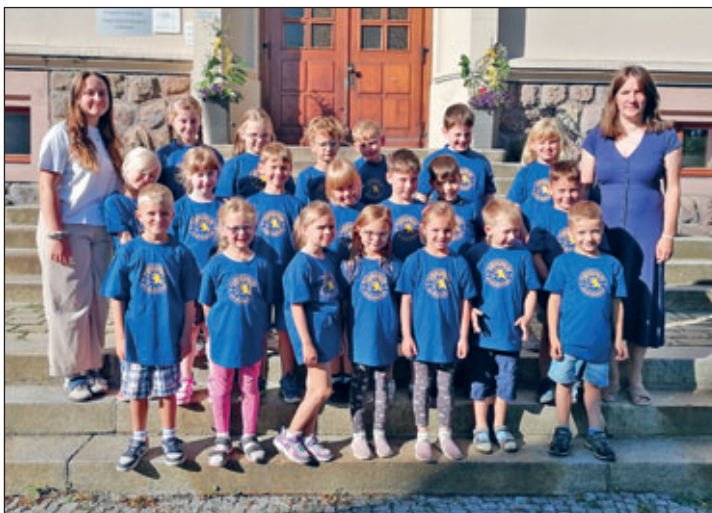
Klasse 1 b