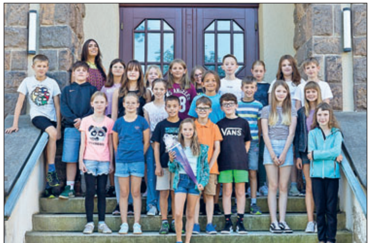
Klasse 5 b