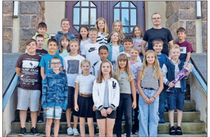
Klasse 5 a