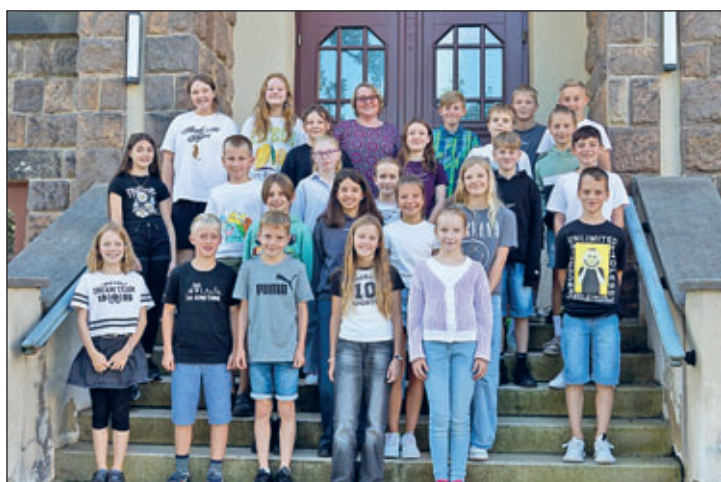
Klasse 5 e