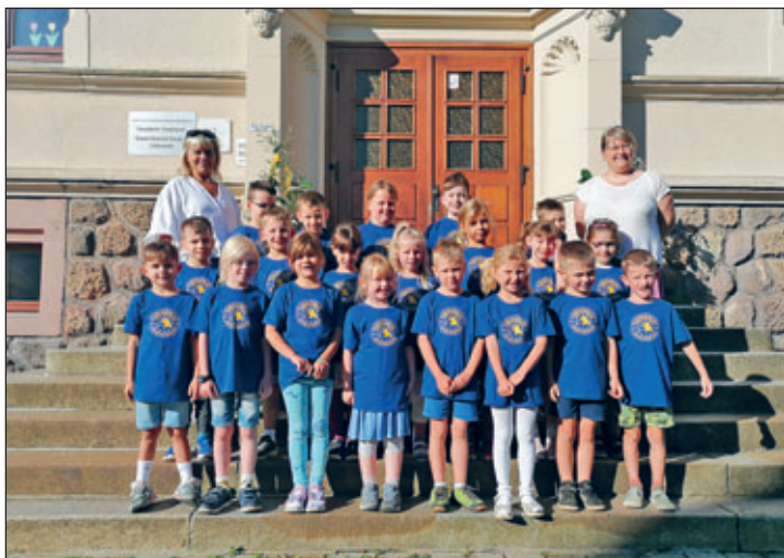
Klasse 1 a