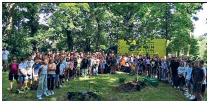
Text und Bild: Annette Melchert/GymNews

Nun kann nicht nur ein neuer Baum wachsen und gedeihen, sondern auch unsere neue Schülerschaft der Klassenstufe 5 wird sich den Herausforderungen am GymLi stellen. Viel Erfolg dabei.