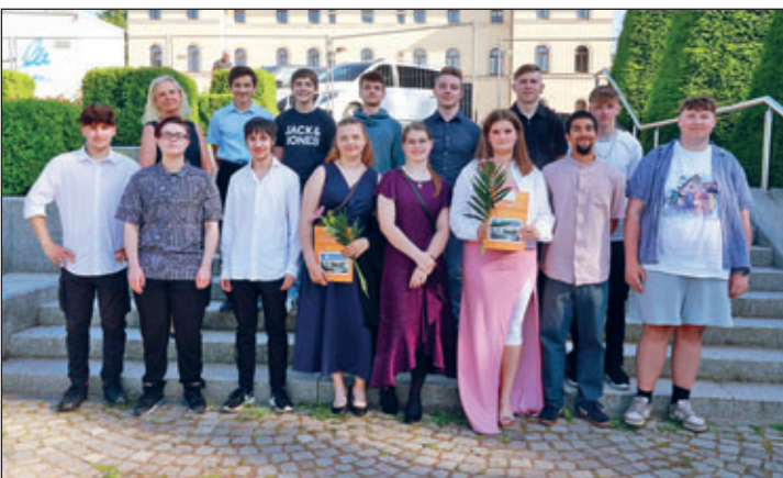
Abschlussklasse 10 b