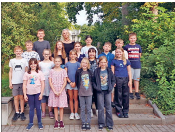
Klasse 5 b