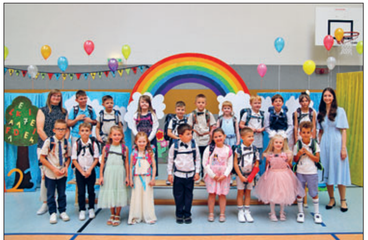
Klasse 1 a