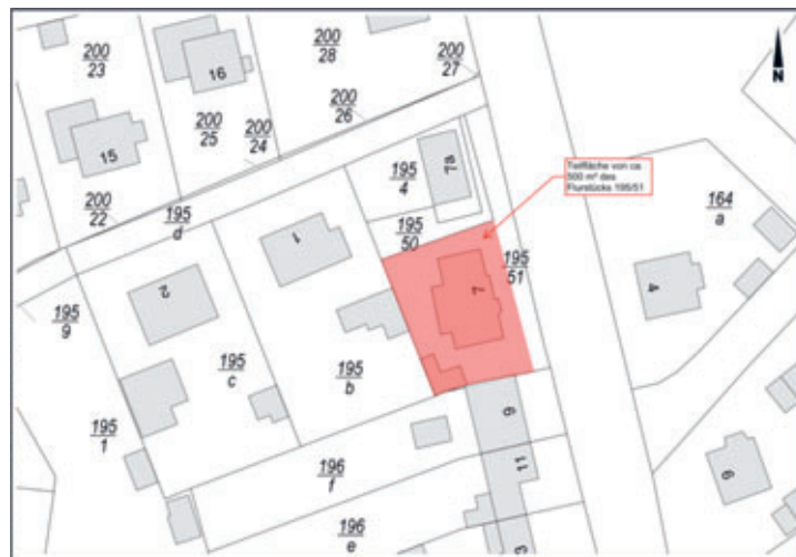
Lageplan – Auszug aus der Liegenschaftskarte (Hinweis: die zum Verkauf stehende Fläche ist rot markiert)