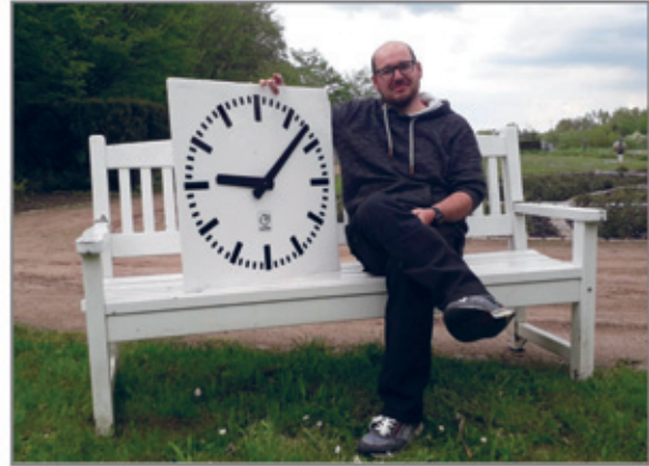
Ein Zifferblatt der Würfeluhr, die bis 2004 an der sog. Großen Brücke (Kreisverkehr) stand, befindet sich im Stadtmuseum. Weitere Uhren aus der Sammlung werden vorgestellt.

Der Sammler und Uhrenfreund Axel Höfer berichtet