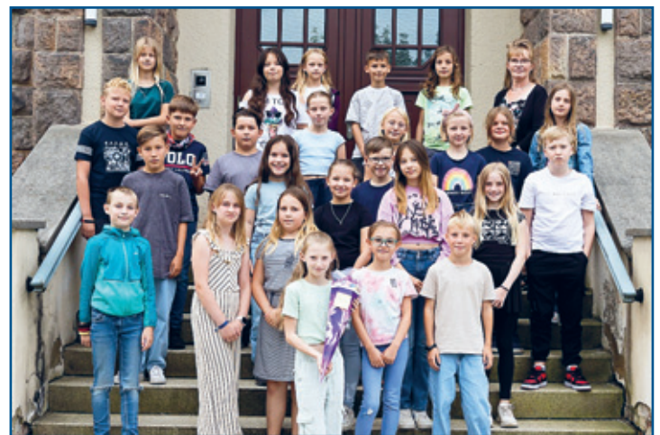
Klasse 5 b