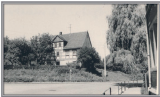
Das ehemalige Lichtensteiner Armenhaus in der Hartensteiner Straße im Jahr 1968.

Vortrag über das Armenwesen mit Angela Schramm und Fotos aus dem Sammlungsbestand