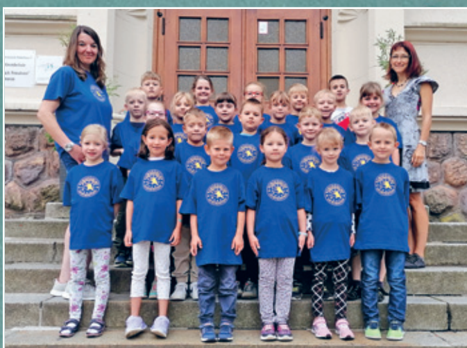
Klasse 1 a der Europäischen Grundschule Lichtenstein