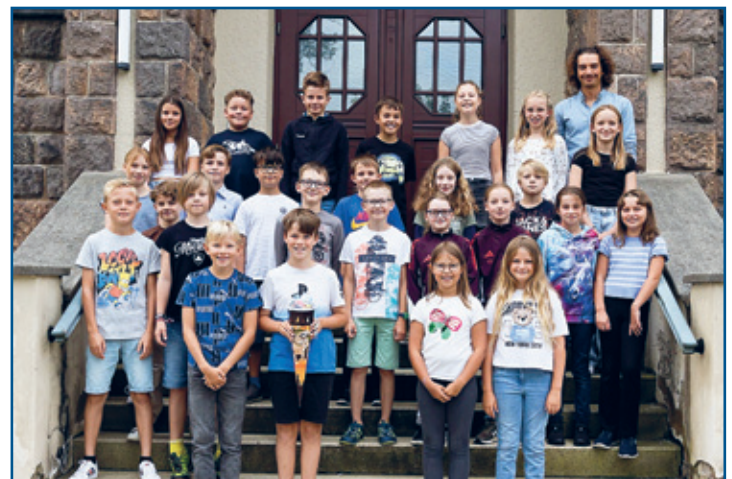
Klasse 5 d