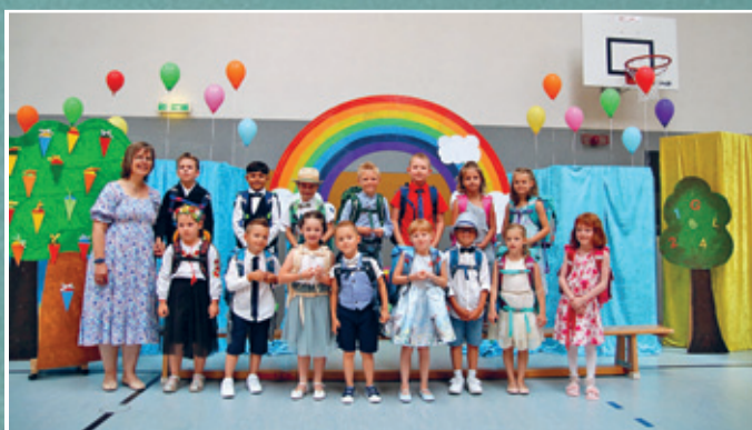
Klasse 1 a der Heinrich-von-Kleist-Grundschule