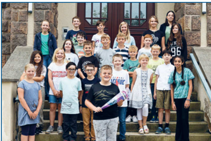
Klasse 5 c