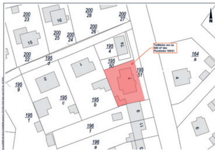
Lageplan – Auszug aus der Liegenschaftskarte (Hinweis: die zum Verkauf stehende Fläche ist rot markiert)

Für Inhalt und Richtigkeit der Ausschreibungs- und Verkaufsunterlagen ist jegliche Haftung ausgeschlossen. Es handelt sich hierbei um eine unverbindliche Aufforderung zur Abgabe von Angeboten, die nicht den Bestimmungen der VOL/VOB unterliegt; kein förmliches Bieterverfahren. Ein Rechtsanspruch auf Erwerb leitet sich aus der Teilnahme an der Ausschreibung nicht ab.