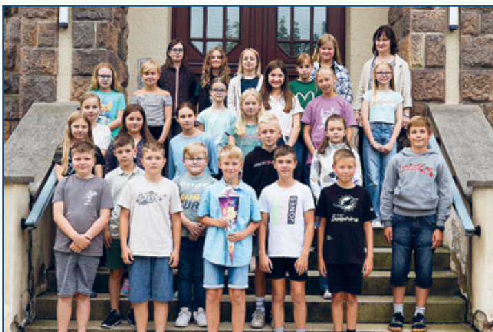
Klasse 5 a