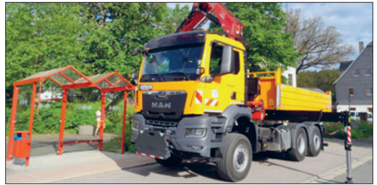
Im April 2024 wurde unser neuer LKW in den Dienst genommen. Er verfügt über einen Ladekran und ist mit der neusten Technik ausgestattet.

Der Tierschutzverein „Tierfreunde helfen Tieren in Not e.V.“ informiert auf unserer Website unter www.lichtenstein-sachsen.de über die zu vermittelnden Tiere.